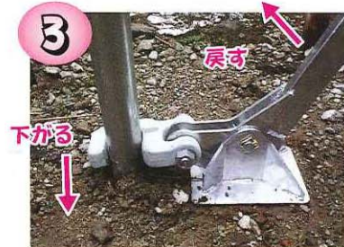
戻すと金具が下がる