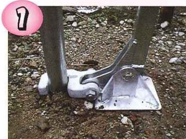
杭抜きをパイプにセット