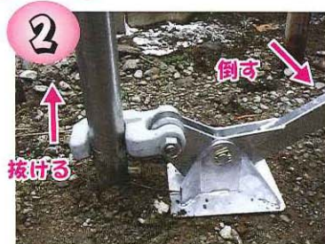
手前に倒すとパイプが抜ける